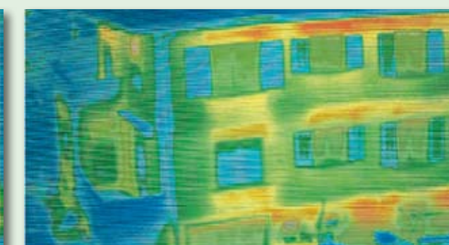
Aufnahme mit rekord-Wärmeschutzverglasung (geringer Energieverlust)