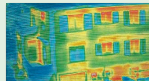
Aufnahme mit 1-fach-Verglasung (hoher Energieverlust)

Die zukünftige EnEV fordert für neue Fenster einen Uw-Wert von 1,3 W/m²K. Mit speziellen Wärmeschutzgläsern von rekord erfüllen Sie diese Anforderungen schon jetzt! Mit weiteren Wärmeschutzmaßnahmen (z. B. „Warme Kante“) können Sie sogar den zukunftsweisenden Uw-Wert von 0,7 W/m²K erreichen – das ist unter Passivhaus-Niveau! Und damit sehen Sie weiteren Verschärfungen der EnEV entspannt entgegen.